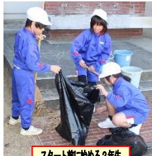
スタート前始める2年生

12月2日(月)の昼休み、環境緑化委員の呼びかけに応え90名が参加し、16袋分も集めてくれました。11日(水)にもがんばってくれました。休み時間に自主的に活動する子もいます。