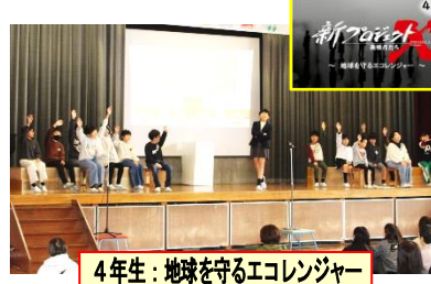
4年生: 地球を守るエコレンジャー