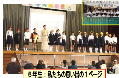
6年生: 私たちの思い出の1ページ