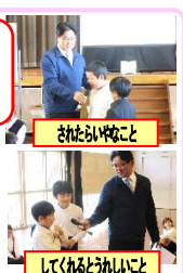
さなはらいやなこと