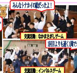
交流活動: なかがしゲーム