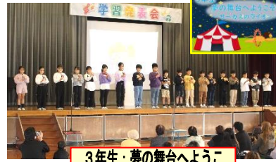
3年生: 夢の舞台へようこ