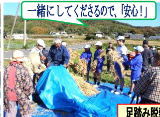
足踏み脱穀機を使って