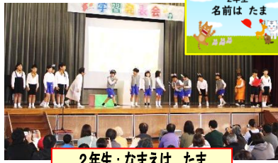
2年生: なまえは たま