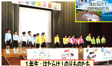
1年生: はたらけ! のりものたち

11月16日(土)、笠田っ子のキラキラと輝く姿がたくさん見られました。ご声援、ありがとうございました。