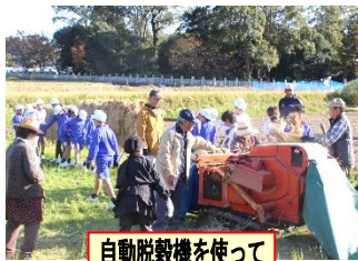
自動脱穀機を使って

12月2日(月)、5年生が脱穀を体験しました。松寿会の方々のお世話で、安心して行うことができました。落穂拾いにも一生懸命で、たくさん収穫できました。