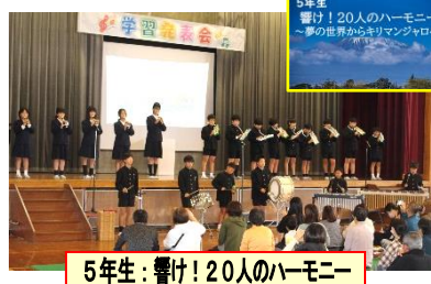
5年生: 響け! 20人のハーモニー