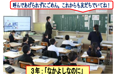
呼んであげられずにごめん。これからも友達でいてね!