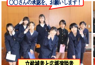
OOさんの承認を、お願いします!

4・5年生から選出されたメンバーによる新児童会役員が決定しました。いずれも立候補した児童です。全校生のためにという心意気が、すばらしいです。