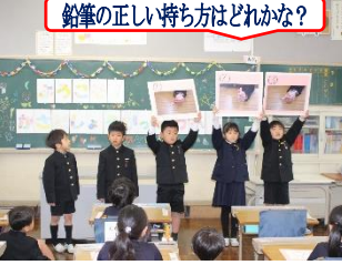
鉛筆の正しい持ち方はどれかな?