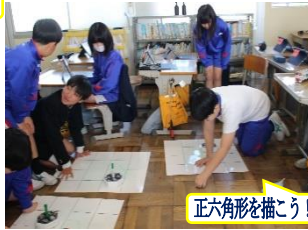
正六角形を描こう!