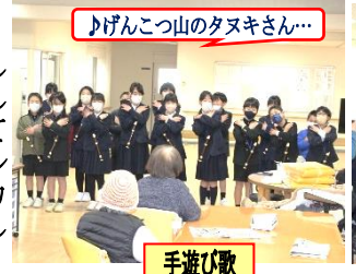
♪げんこつ山のタヌキさん...

2月10日(月)、とよなか荘を訪問しました。歌や演奏や昔の遊びを披露したり、一緒に風船パレーをしたりしてふれあいました。お手紙、お花、アルミ缶回収費を資金としたシルバーカーをプレゼントすることもできました。喜んでいただいていたようです。