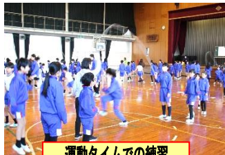
運動タイムでの練習

2月12日(水)、全校生が色別に分かれて8の字跳びに挑戦しました。練習の成果を発揮し、新記録を樹立したチームもありました。応援もすばらしかったです。