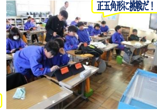
正五角形に挑戦だ!