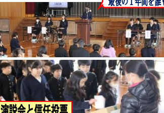
最後の1年間を誰もが笑って...