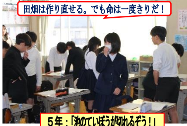
田畑は作り直せる。でも命は一度きりだ!