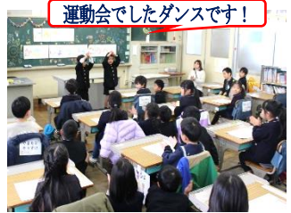
運動会でしたダンスです!

2月4日(月)、来年度の入学予定者を招いて体験入学を行いました。1年生は行事を紹介したり、鉛筆の持ち方を伝えたり、伝承遊びを披露したりと大活躍でした。新入生の姿から、入学への楽しみの高まりが感じられました。