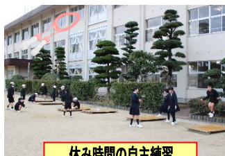
休み時間の自主練習