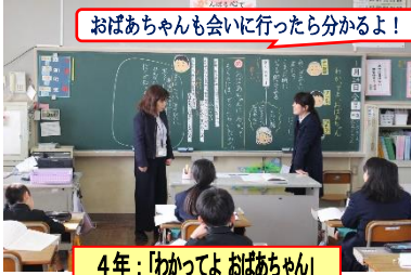
おばあちゃんも会いに行ったら分かるよ!