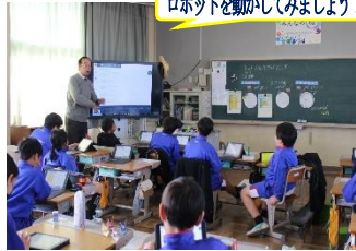
ロボットを動かしてみよう!

1月30日(木)、三豊市教育委員会の学習ICT支援員さんのお世話になり、ロボットを動かすことを通して、プログラミングの面白さを実感することができました。