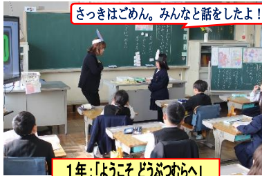
さっきはごめん。みんなと話をしたよ!

1月26日(金)、人権に関する授業参観、次年度の役員決定等ありがとうございました。