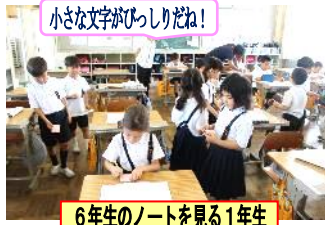
6年生のノートを見る1年生

9月5日(木)、全学年で自主学习ノート展が行いました。夏休み中の家庭学習の成果を見て、よいところを学び合いました。どの学年も真剣に読み進め、付箋紙に書いていました。