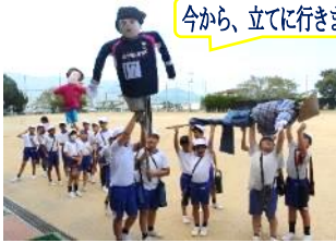
今から、立てに行きます!

9月9日(月)、松寿会の皆様にお世話いただき、5年生が4体の案山子を水田に設置しました。内1体は、松寿会の皆様で作製されたものです。