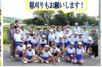
稲刈りもお願いします!