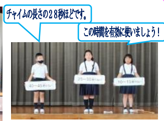
チャイムの長さの28秒ほどです。