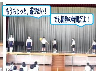
もうちょっと、遊びたい!