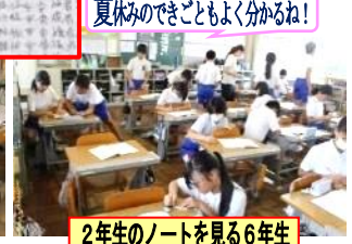
2年生のノートを見る6年生