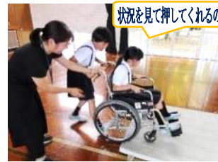
状況を見て押してくれるので、安心です!

9月13日(金)、市の社会福祉協議会の皆様のお世話で、車いすの活用を体験しました。乗り手を意識した声かけや段差での押し方のポイントなどを学びました。