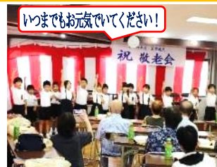
いつもでも元気でください!

9月15日(日)、1・2年生が笠田地区の敬老会に参加し、歌やダンスを披露しました。高齢者の方々との交流の中で、たくさんの笑顔の花が咲きました。