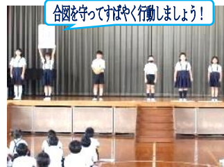
合図を守ってすばやく行動しましょう!

9月6日(金)、放送委員会による生活目標の周知がありました。自分の発表の言葉を暗記し、劇をまじえ、全校生に分かりやすく伝えてくれました。