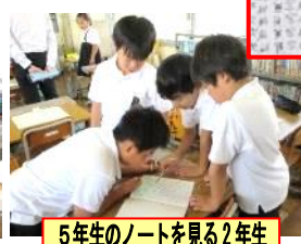
5年生のノートを見る2年生