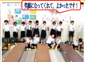
笑顔になってくれて、よかったです!