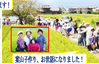
案山子作り、お世話になりました!