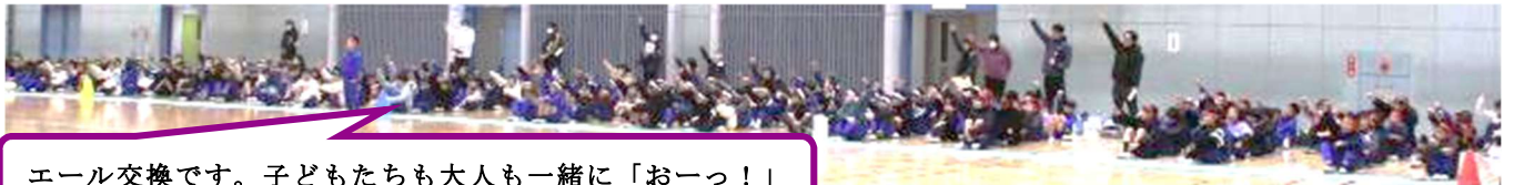
エール交換です。子どもたちも大人も一緒に「おーっ！」

低学年の子の背中を押してあげた子たち、練習、本番を2回ずつと合計16分間縄をまわした子たち、間をあげずに入ろうと集中していた子たち、しっかりと応援をしていた子たちが印象に残りました。また、結果発表では、全てのチームに拍手をおくっているなど、対抗とは言いながら、3校の子たちのあたたかいふれあいの大会となりました。