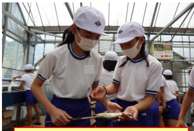
あまごの塩焼き最高！