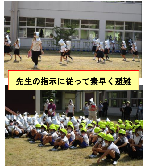
先生の指示に従って素早く避難

地震だけでなく、台風、集中豪雨などの自然災害は、いつ、どこで、起こるか分かりません。今回の避難訓練を機会に、ご家庭でも、自然災害が起こったときに、どこに避難するのか、避難経路はどこがいいのかを話し合い、「災害発生時の約束」を決めていただければと思います。よろしくお願いします。