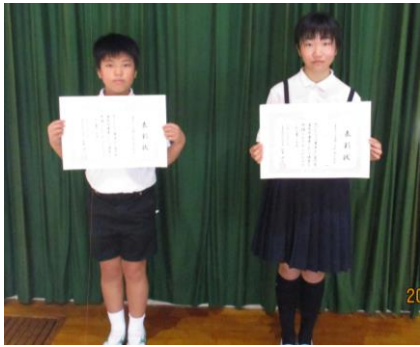
上高瀬小学校の代表に選ばれました。おめでとう!