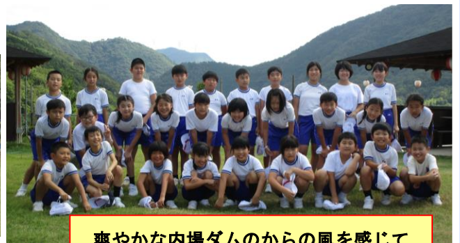
爽やかな内場ダムからの風を感じて