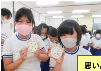
思い出の品ができました！

8月26日に5年生は、香川県の奥座敷である塩江町で野外体験活動を行いました。活動内容は、皮のキーホルダーづくり、タイヤコースターづくり、あまごのつかみどり体験、グランドゴルフ、ブルーベリー収穫体験と盛りだくさん。どの活動も、目を輝かせて楽しそうに取り組んでいました。特に、あまごのつかみどりは、夢中になりすぎて、水の中で尻もちをつく子も…。自分で捕った焼きたてのあまごの味は、最高だったようです。命をいただくという感謝の気持ちを感じる機会にもなりました。全員が元気に参加できてよかったです。