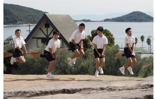
魔法のほうきに乗ってレッツゴー!