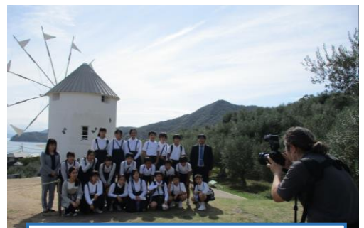
ギリシャ風車の前で「チーズ」