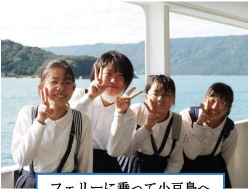
フェリーに乗って小豆島へ

一日ではありましたが、学校を離れてたくさんのことを経験することができました。このことを今からの学びや生活に生かして行ってほしいと願っています。