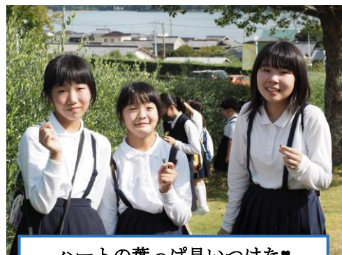
ハートの葉っぱ見つけた♡