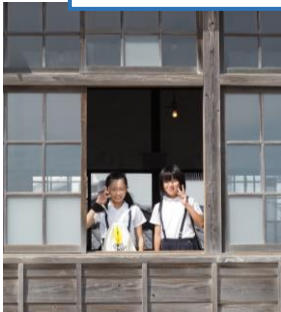
木造の校舎の窓から