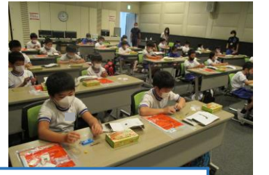
4年：e-とぴあ香川・防災センター