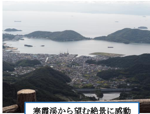
寒霞溪から望む絶景に感動