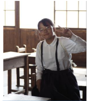
木の椅子に座って