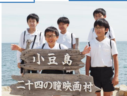
小豆島 二十四の瞳映画村