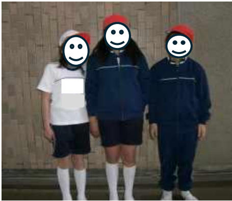
夏の体操服・冬の体操服・赤白帽子