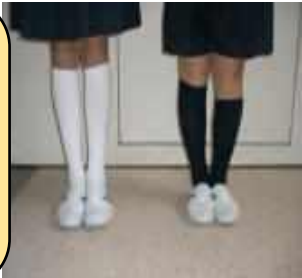
靴下は白か紺か黒を着用 (「くるぶし」がかくれる長さ)