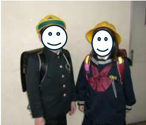
通学時は黄色い帽子を着用 (配布) ランドセルカバー (配布) (カバーは1年生は1年間使用します。)