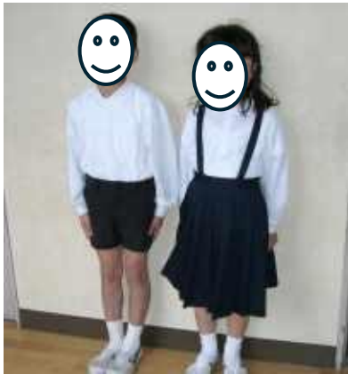
春・秋の標準服 (男女ともに、白いポロシャツ。夏は半袖可)