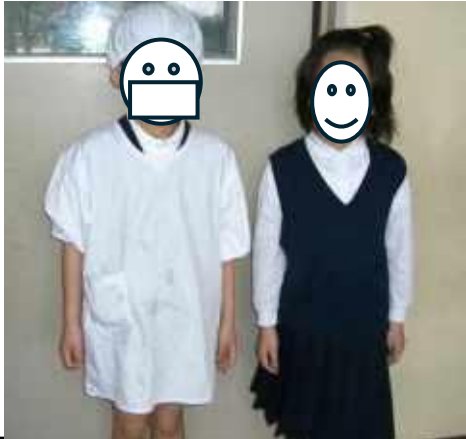
給食エプロン ベスト