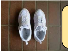
下靴は白色 マジックテープ靴か サイズによってひも靴も