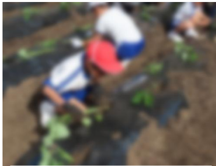
サツマイモのつるさし (5/7)

学級と個人のなかよしめあての発表をしました。みんなが幸せになれるように行動できるといいですね。