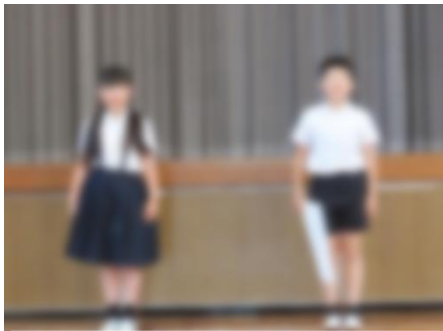
人権なかよし集会 (5/8)

学級と個人のなかよしめあての発表をしました。みんなが幸せになれるように行動できるといいですね。