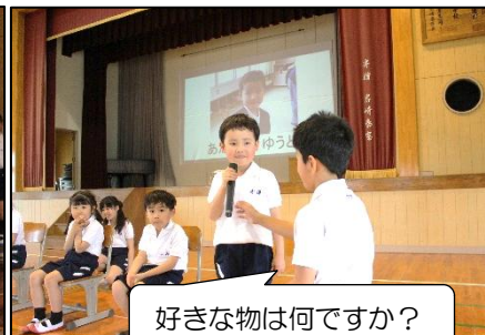
好きな物は何ですか？