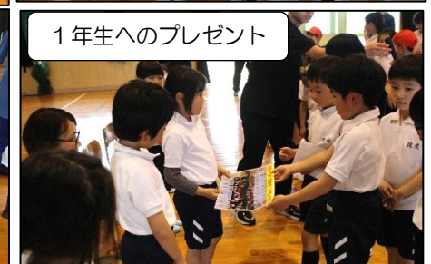
1年生へのプレゼント