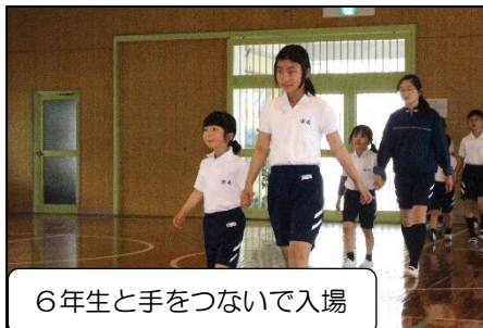
6年生と手をつないで入場

6年生が中心になって企画・運営をしてくれた「1年生をむかえる会」では、全校生が楽しい時間を過ごすことができました。1年生の笑顔を見ることで、他の学年の人もうれしい気持ちになったと思います。6年生が、タブレットを活用して大きく写真等を映し出してくれたり、ゲームの説明を具体的に示してくれたりして、スムーズな運営をしてくれました。大変充実した45分間でした。