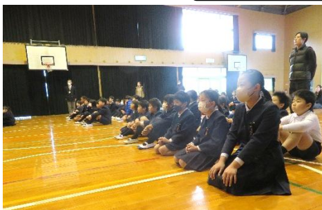
集中して話を聞いていました。