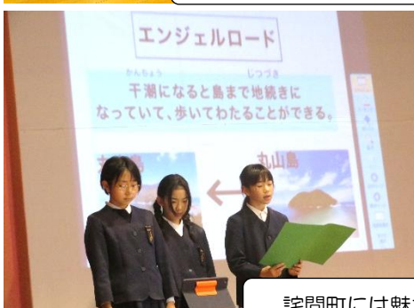
詫間町には魅力的な島もあります。