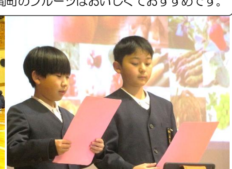
カキや鯛そうめんなどが有名です。