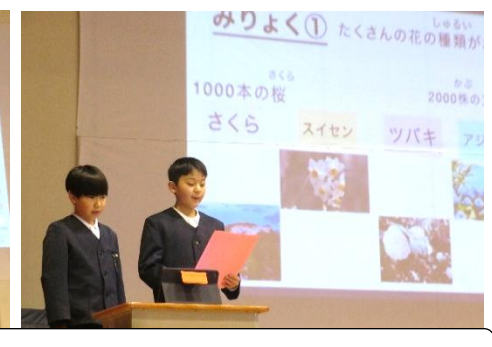
詫間町のフルーツはおいしくておすすめです。