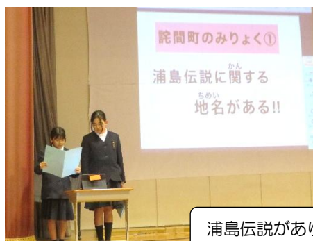
浦島伝説があります。

5年生の発表は、大事なことやぜひ伝えたいということに内容を絞って、発表してくれたので大変分かりやすかったです。5年生の伝えたいという思いが感じられる発表でした。