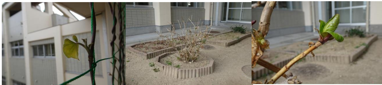
▲グリーンカーテンの新芽 ▲遠目に見た紫陽花（あじさい） ▲紫陽花の新芽

努力して、違う角度から広い視野で物事を見るとともに、近くにいる素敵な人や素敵なものを見逃さないように、歩いていってください。