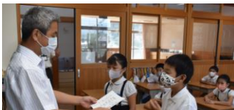
各学級で任命しました