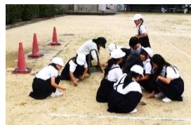
＜休み時間の草ぬき＞

休み時間に運動場の草をぬく子、目標をもって陸上練習に参加する子、自分が使ったのではないのにトイレのサンダルを揃える子、便器を一生懸命に磨く子、あいさつ運動に自主的に参加する子、廊下で出会ったときにあいさつしてくれる子、ペア学年の子に読み聞かせをする子、友だちに学習のアドバイスをやる子、自主学習を毎日続けている子、時間をかけて自主学習に取り組む子、外遊びに誘ってあげる子、他学年の子と一緒に遊ぶ子、落ちているごみを拾う子、欠席した友だちの係の仕事を行う子、しまい忘れていたボールを片付ける子…、自主的に励む子らの顔はキラキラと輝いています。これらのがんばりは、「笠田の花」に書かれたりしていますが、大切なのは、誰かに評価されることを望むのではなく、自らの意思で「誰かの役に立ちたい。自分を高めたい。」と行動することです。「自分の心を磨く」ことは、自分にしかできないことだと思います。美しい心が学校中に広がっていくことを願っています。12月には、2学期中の「やればできた」を紹介する予定です。