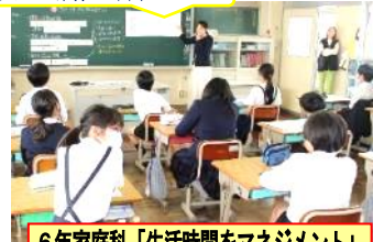
6年家庭科「生活時間をマネジメント」