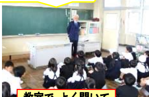
教室でよく聞いて