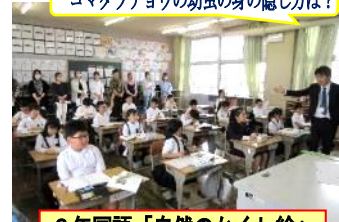
3年国語「自然のかくし絵」