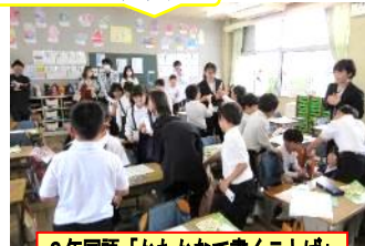
2年国語「かたかなで書くことば」