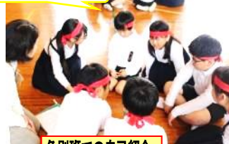
色別班での自己紹介