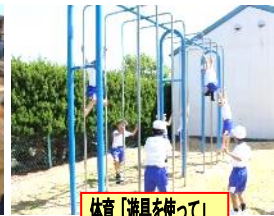
体育「遊具を使って」