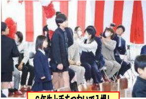
6年生と手をつないで入場し