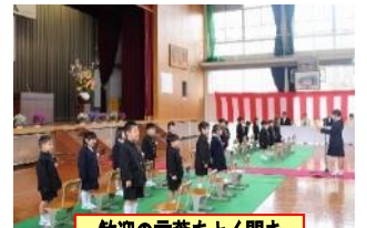
歓迎の言葉をよく聞き