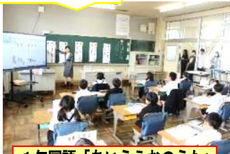
1年国語「あいうえおのうた」