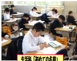
生活科「初めての名前」

小学校生活が始まりました。集中して学習をしたり、運動をしたり、掃除をしたりと、毎日、がんばっています。