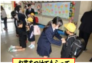
お花をつけてもらって