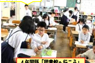
4年国語「図書館へ行こう」