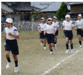
12/2 校内マラソン大会