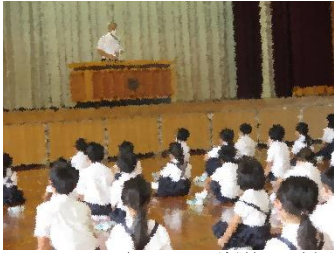
9/1 2学期の始業式・夏休み作品展