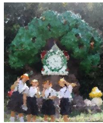
9/28・29 修学旅行(高知・香川)