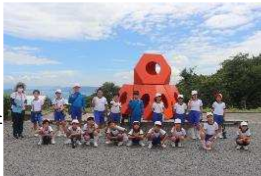
【五色台少年自然センターにて】

7月6日（水）、7日（木）に、5年生が、五色台で集団宿泊学習を行いました。宿泊行事のねらいは、「自然の中での集団宿泊的活動などの平素と異なる生活環境にあって、見聞を広め、自然や文化などに親しむとともに、よりよい人間関係を築くなどの集団生活の在り方や公衆道徳などについての体験を積む」ことです。宿泊学習では、「自分のことは自分です、互いに気付いたことは声をかけ合い協力する」という生活が基本になります。今年は、豊中町内の5校が連合で宿泊学習を行うことができ、子どもたちも他校の子どもたちと一緒に様々な活動に取り組むことを通して、また一つ、心も体も大きくたくましく成長することができたように感じます。