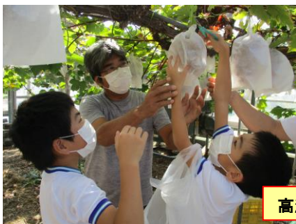
高瀬のブドウはおいしいよ!

4年生は、9月8日にブドウ狩りをしました。おいしいそうなブドウを自分で選んで取りました。ブドウには、いろいろな種類があり、育てるためにたくさんの作業が必要なことを教えていただきました。ブドウ生産者や農林水産課、JAの皆さん、ありがとうございました。