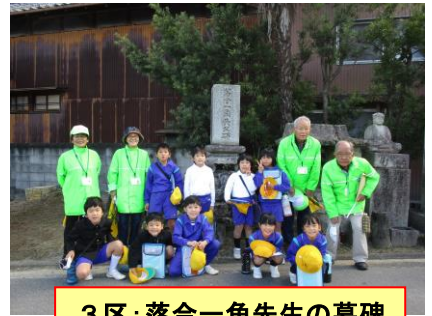
3区：落合一角先生の墓碑