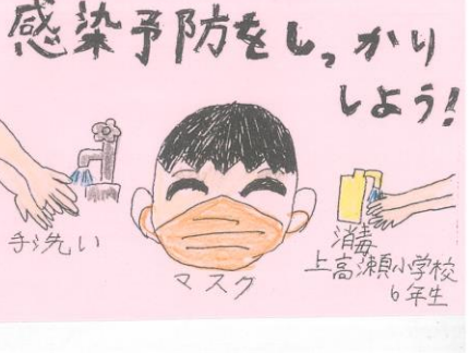
6年生の気持ちが伝わるメッセージカードの一部です