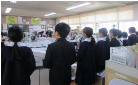
【6年生から教職員へ】

運動会に向けて、6年生が中心となって、4月から準備を進めてきています。競技内容や準備について話し合い、5月9日(月)には、6年生が教職員に話す機会も設けました。その後、各学年や各委員会などで進めてきた運動会です。笑顔いっぱい、元気いっぱいな姿を見ていただけたらと願っています。