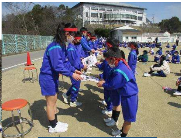
プレゼントの色紙渡し