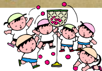
全校生で「ダンシング玉入れ」