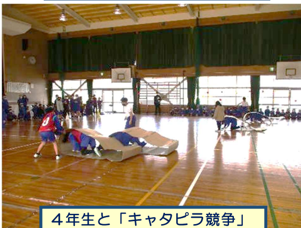
4年生と「キャタピラ競争」