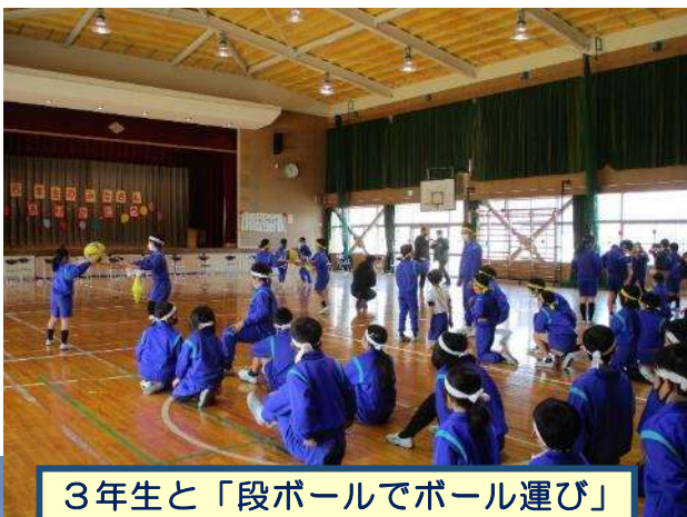
3年生と「段ボールでボール運び」