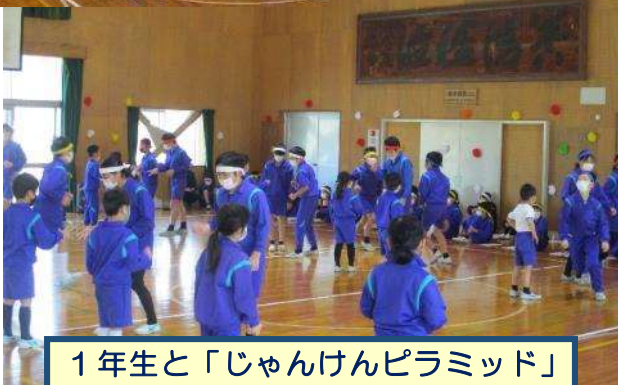
1年生と「じゃんけんピラミッド」