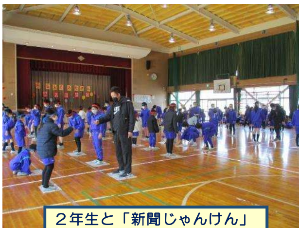
2年生と「新聞じゃんけん」