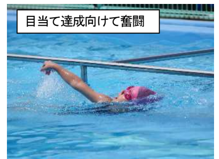
目当て達成に向けて奮闘