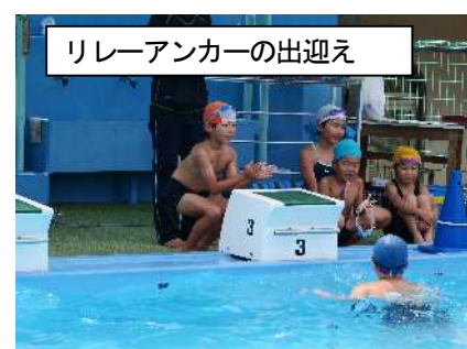
リレーアンカーの出迎え

高学年は25m、50mを目標タイム以内で泳ぐことができました。来年の地区水泳大会が楽しみですですね。