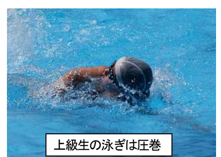
上級生の泳ぎは圧巻