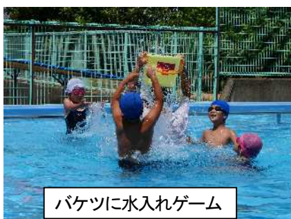
バケツに水入れゲーム