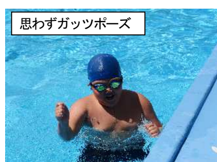
思わずガッツポーズ