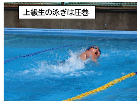
上級生の泳ぎは圧巻