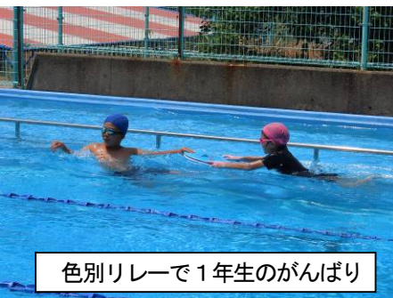
色別リレーで1年生のがんばり