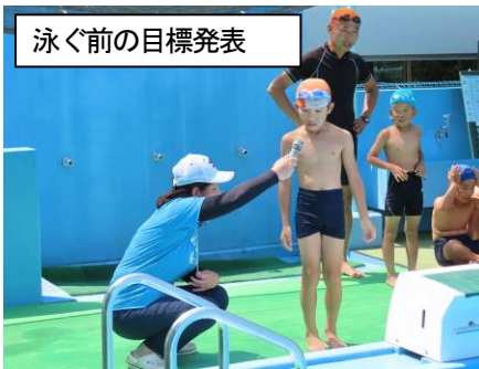
泳ぐ前の目標発表