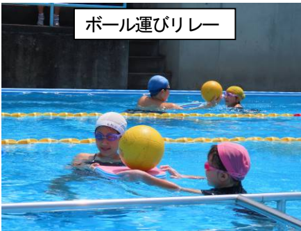
ボール運びリレー