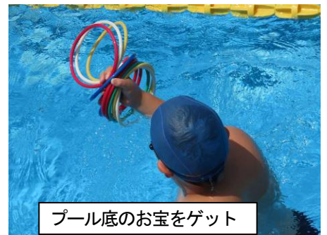
プール底のお宝をゲット