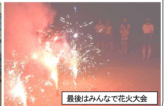
最後はみんなで花火大会