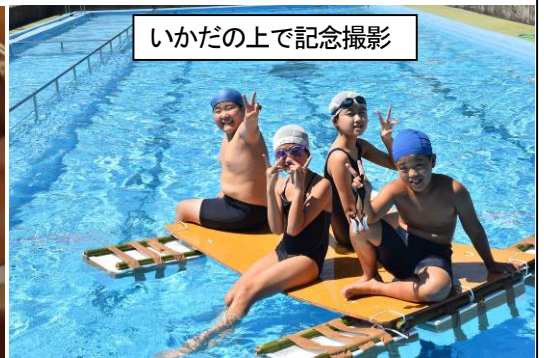
いかだの上で記念撮影