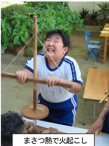
まさつ熱で火起こし

7月28日(水)午後1時頃から9時まで高学年4人でデイキャンプを実施しました。一昨年までは、宿泊学習として、ドラム缶風呂に入ったり、肝試しをしたりして学校に宿泊していましたが、コロナ禍のため今年度は日帰りで野外活動を行いました。いかだを作ってプールに浮かべたり、火起こし器で火をおこしたり、野外炊事をしたり、天体望遠鏡で金星を見たり……。あまり経験したことのない野外活動にみんな楽しそうに頑張っていました。