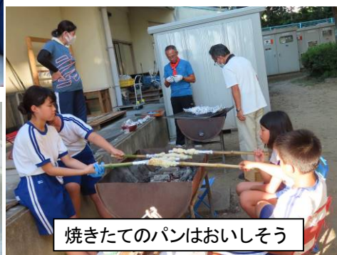
焼きたてのパンはおいしそう

夕食のメニューは、鮭とささみのホイル焼き、学校でとれたジャガイモのバター焼き、竹にパン生地を巻きつけて焼いた竹パンでした