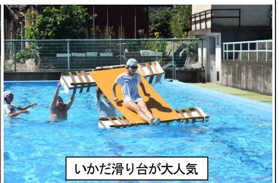
いかだ滑り台が大人気