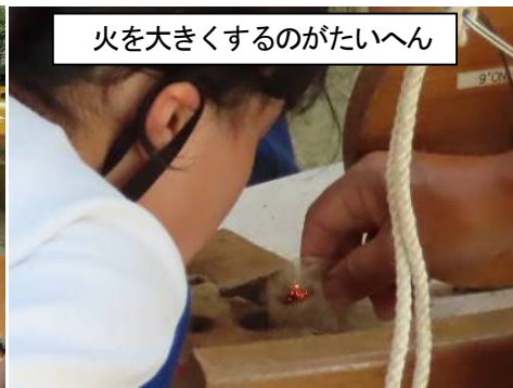
火を大きくするのがたいへん