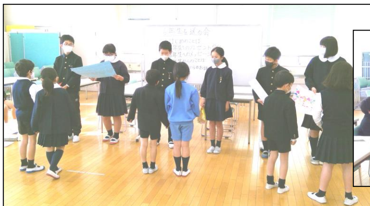
各学年からのプレゼント贈呈

新児童会役員さんにとっては、これが最初のお仕事となりました。素晴らしい会を、ありがとうございました。