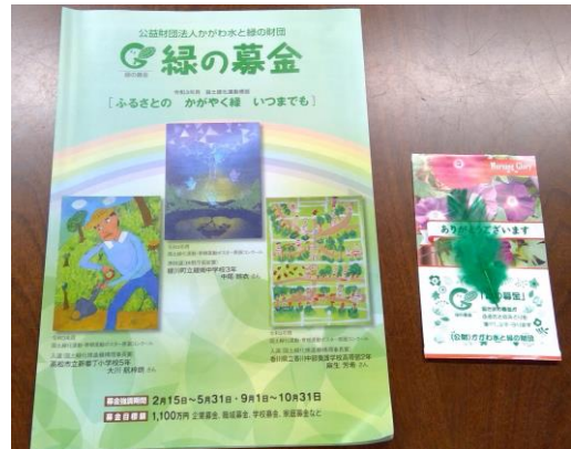
【募金いただいた方にさしあげます】