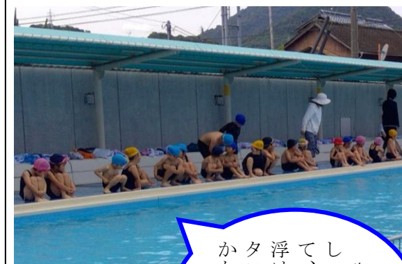
【プール開きの様子】

6月8日(水)に水泳学習が始まりました。2クラスと一緒に、プールに入り、水をかけたり、プールの中を歩いたりしました。プールがある日は、「やったー!プールだ!」と朝から嬉しそうです。