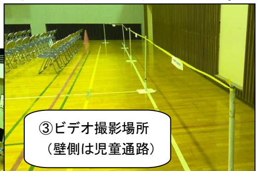
③ビデオ撮影場所 (壁側は児童通路)