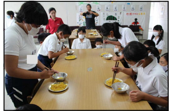
手前側 決勝戦 NTさんVS KFさん 向こう側 3位決定戦 TFさんVS YFさん