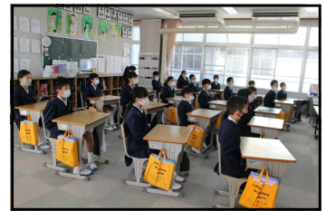
<真剣に話を聞いている4年生>