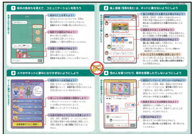
<高学年・中学生用裏面>