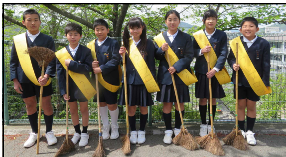
〈おそうじプロジェクトチーム〉