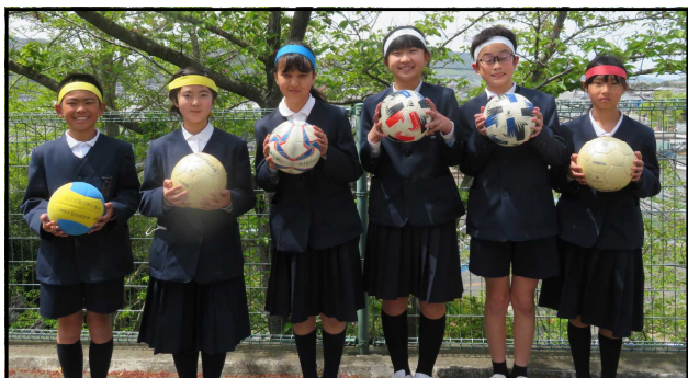
〈なかよしプロジェクトチーム〉

今年も松崎小学校の特色の一つである「三大プロジェクト」が発動しました。6年生の各プロジェクトチームを中心に、『全校生が笑顔でなかよく活動する松崎小学校』をめざして様々な活動に取り組めます。例年でしたら全校集会で、6年生の各プロジェクトチームからめあてな活動内容の発表をしますが、今年は、22日（木）に6年教室と各教室をつないでリモートで行いました。1年教室はうまくつながらなかったため、6年生が1年教室に行き密に気をつけながら発表しました。20名の6年生が、松崎小学校全校生の先頭に立って活躍してくれることでしょう。