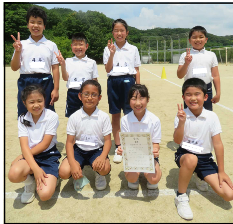
中学年の部<赤チーム>