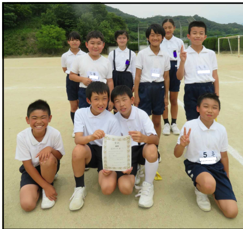
高学年の部<黄チーム>

三大プロジェクトの一つ「なかよしプロジェクト」の色別班対抗しっぽとりが、学年団ごとに行われました。6年生のプロジェクトチームの司会・進行で進められ、運動場・体育館で笑顔で元気に楽しむ姿が見られました。各学年団の優勝チームは以下の通りです。