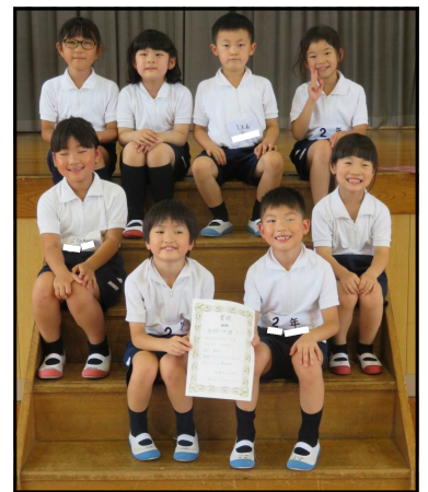
低学年の部<黄チーム>