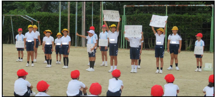
<1人が1日に使う水の量は約何Lでしょうか？>

4年生が、さわやかタイムで社会科の学習で学んだ「節水」の大切さを伝える発表をしました。役割分担をし、自分の台詞をわかりやすく大きな動作も交えながら発表してくれました。また、節水について「手を洗うときに水を出しっぱなしにしたら」「絵の具セットを洗うときのこつ」等について、自分たちが実践・検証したデータをわかりやすく紹介してくれました。そして最後に「みなさんも自分にできることを見つけて、節水に取り組んでみませんか？」と呼びかけることができました。