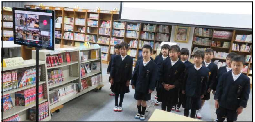
<上級生の感想を聞く1年生>