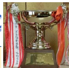
バドミントン部男子は 総合優勝しました。

陸上部、ソフトテニス部男子、バレーボール部男子、 バドミントン部男子、剣道部男子、剣道部女子、 新体操部(校外部)、水泳部(校外部)