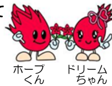
ホープくん ドリームちゃん