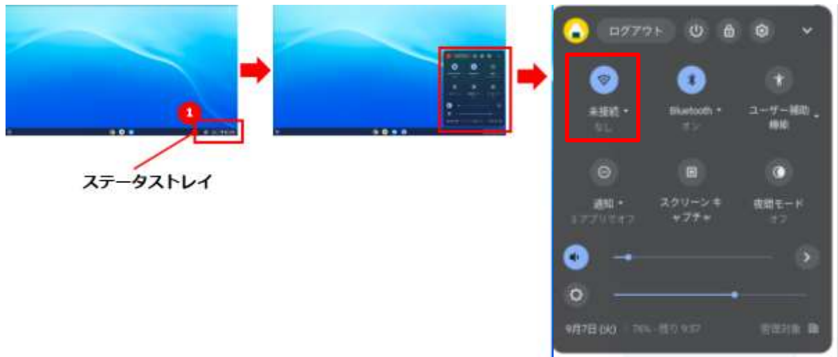
ステータストレイ