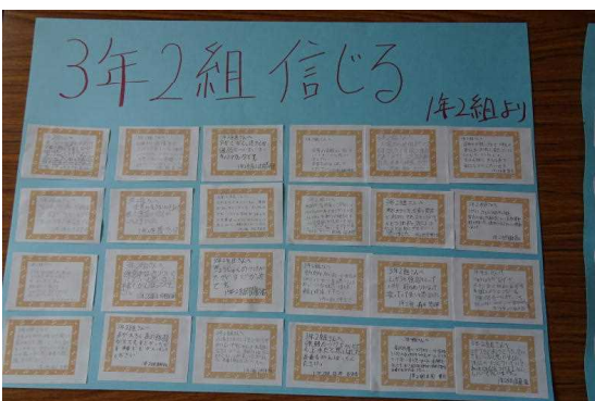
▲ 1年2組から3年2組へのメッセージ