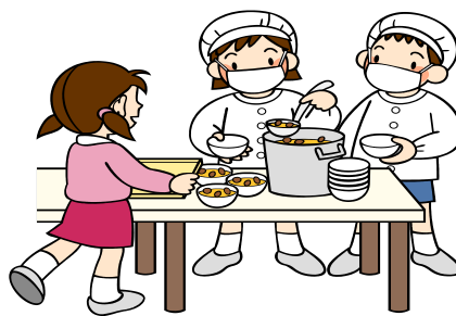
【給食の準備は継次タイプありがたい】

自分を知ることは大切です。自分の思考タイプを知ることによって生活にもゆとりが出来ます。こんな経験はありませんか？授業の内容を先生から聞いたときは、はっきりしなかったことが友達から説明されるとすっきりと理解できる。また、友達に説明してもうまく伝わらなかった事が、先生にはすんなりと伝わる。人は、それぞれ過ごしている環境も違うし、考え方も違います。自分の得意不得意を知ることによって相手に対する接し方も変わってくると思います。どちらのタイプの人にもわかりやすい話し方や説明ができるといいですね。また、自分なりに工夫して話すことにもつながりますよね。裏面に思考タイプチェックシートを載せておきます。参考にしてみてください。